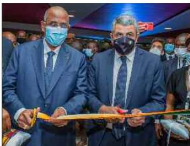
L'espoir de la relance de l'industrie touristique est fondé sur la lutte contre la Covid-19

Le tourisme mondial est l'un des secteurs clés de l'économie qui a été fortement secoué par la crise sanitaire de la Covid-19 et ses impacts. La pandémie n'est pas encore enrayée, mais déjà, les professionnels de l'économie touristique songent à l'après crise sanitaire.