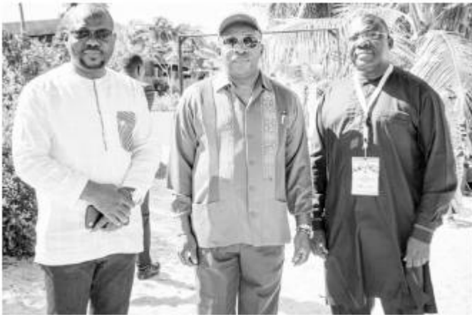
Siandou Fofana, ministre du Tourisme et des loisirs lors de la croisière lagunaire.