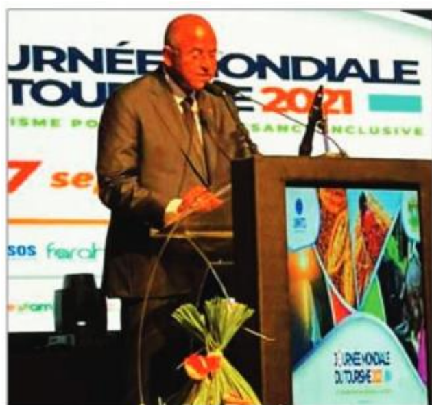
Le Premier ministre Patrick Achi s'est félicité de la tenue de la Jmt en terre ivoirienne.

La Côte d'Ivoire a abrité, hier, pour la première fois de son histoire et celle de l'Afrique francophone, la Journée mondiale du Tourisme (Jmt) 2021 autour du thème : "Le tourisme pour une croissance inclusive". Le Premier ministre Patrick Achi, au cours de la cérémonie d'ouverture de la 41 ème édition de cette Journée en terre ivoirienne, au Palais des Congrès du Sofitel Abidjan Hôtel Ivoire sis à Cocody, a rappelé l'importance du secteur dans l'économie mondiale, après avoir relevé l'impact de la pandémie à Covid-19 sur les activités touristiques à travers le monde. Parrain de la cérémonie, le chef du gouvernement ivoirien, paraphrasant l'évêque africain Saint Augustin qui a défini l'essence du voyage en quelques mots, fera savoir, d'entrée, que "le monde est un livre et ceux qui ne voyagent pas n'en ont lu qu'une seule page". Car " Oui, voyager, c'est apprendre. Pour mieux raconter. Voyager, c'est comprendre. Pour mieux accepter. Voyager, c'est recevoir. Pour mieux donner. Voyager, c'est ce désir universel, occupant une place centrale dans nos vies, dans nos villes, dans notre économie, dans notre rapport au monde. Voyager, enfin, c'est en chacun de nous