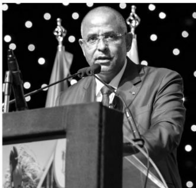
Le Premier ministre Patrick Achi

La 41ème Journée mondiale du tourisme a été ouverte par le Premier ministre Patrick Achi, le lundi 27 septembre 2021 au palais des congrès du Sofitel hôtel Ivoire-Abidjan. Ci-dessous son discours intégral