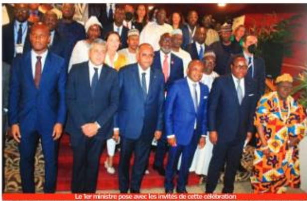
Le 1er ministre pose avec les invités de cette célébration

Parée de ses plus belles tenues traditionnelles et de ses plus admirables attributs touristiques, la Côte d'Ivoire a accueilli, lundi 27 septembre 2021, à Abidjan-Cocody, la cérémonie d'ouverture de la 41 e édition de la Jmt, Journée mondiale du tourisme. Un événement majeur qui rassemble plus de 128 pays et accueille plus de 1500 participants venus des 4 coins du monde.