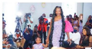
Cette cérémonie de lancement a été ponctuée par un mini défilé de plusieurs mannequins.