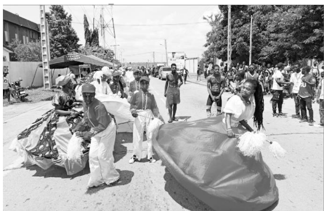
Une vue de la parade avec les marionnettes géantes.

dénoté " Festourdimkro", d'une exposition artisanale commerciale et gastronomique. Aussi, faut-il ajouter des démonstrations de danses traditionnelles, d'us et coutumes du peuple Baoulé Agba et des peuples à l'honneur. A savoir Akyé et Abbey. Circuit touristique de découverte du terroir, concerts d'artistes modernes et tradi-modernes augurent une belle fête en ce début de vacances d'été dans la cité du partage et du soleil radieux.