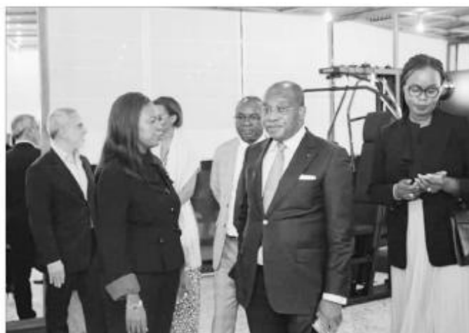
Le ministre Siandou Fofana à "La Maison Palmier".