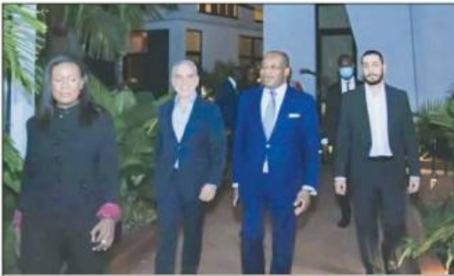
Le ministre Siandou Fofana à "La Maison Palmier".