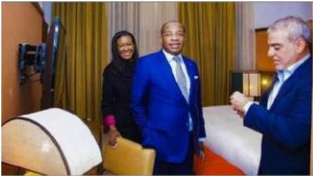
Le ministre du Tourisme, Siandou Fofana, en visite dans le complexe hôtelier