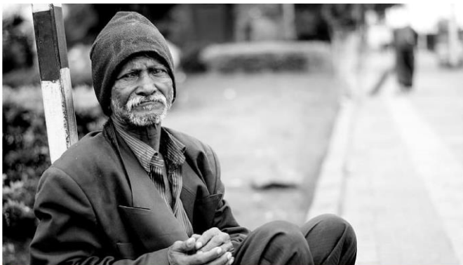
La main d'œuvre non qualifiée subit le choc de la réduction du tourisme

L'économie mondiale pourrait perdre 4 000 milliards de dollars de produit intérieur brut (PIB), uniquement pour les années 2020 et 2021, du fait de l'impact de la pandémie sur le tourisme. Ce constat émane du rapport conjoint de la Conférence des Nations unies sur le commerce et le développement (CNUCED) et l'Organisation mondiale du tourisme des Nations unies (OMT).