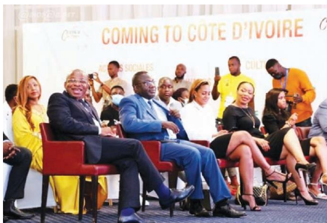
Le ministre du Tourisme et des Loisirs, Siandou Fofana, soutient cette initiative qui s'inscrit dans le programme "Sublime Côte d'Ivoire" du gouvernement