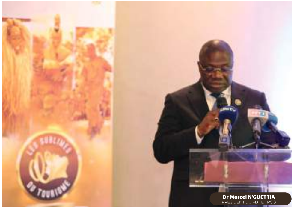
Dr Marcel N'GUETTIA PRÉSIDENT DU FDT ET PCO

En somme, cette deuxième édition de « Les Sublimes du Tourisme» s'inscrit dans une démarche de développement touristique ambitieuse et confirme la volonté de la Côte d'Ivoire de se positionner parmi les destinations touristiques les plus attrayantes du continent africain. Le Ministre du Tourisme Siandou Fofana et l'ensemble des acteurs impliqués dans cet événement sont déterminés à offrir aux visiteurs une expérience inoubliable et à faire briller la Côte d'Ivoire aux yeux du monde entier.