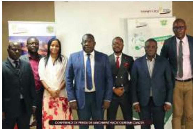
Hacktourisme » lancé le 9 juin au Palm-Club Hôtel d'Abidjan

De façon spécifique, le hacktourisme CAN 225 viendra répondre principalement au défi d'une expérience touristique de qualité pour les visiteurs et populations locales à l'occasion de la CAN 2023. En effet, le secteur tourisme sera en première ligne en ce qui concerne l'accueil, l'hébergement, la restauration et les activités de loisirs qui seront réservées à ces différentes populations. Pour relever donc ce défi de la CAN de l'hospitalité, ce hacktourisme CAN 225 vise à apporter des réponses innovantes, créatives et à forte valeur ajoutée, implémentable à court