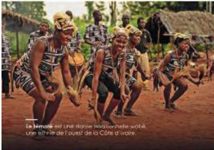
Le lématé est une danse traditionnelle wobé, une ethnie de l'ouest de la Côte d'Ivoire.