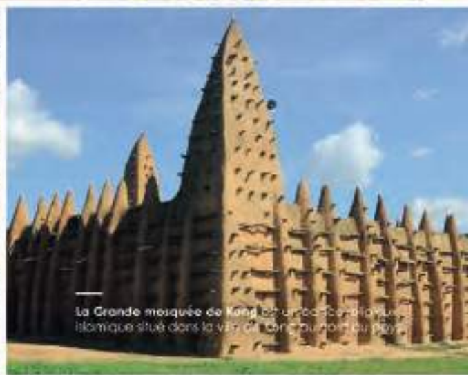
La Grande mosquée de Kong est un bâtiment religieux historique situé dans la ville de Kong au nord du pays.