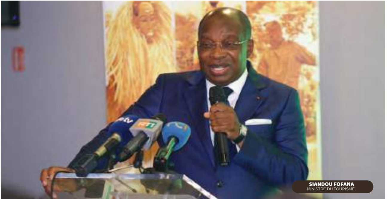
SIANDOU FOFANA MINISTRE DU TOURISME