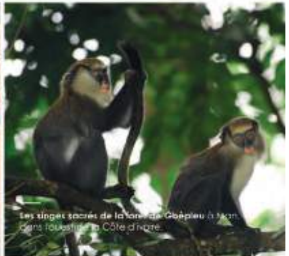
Les singes sacrés de la zone de Gbapleu à Man, dans l'ouest de la Côte d'Ivoire.