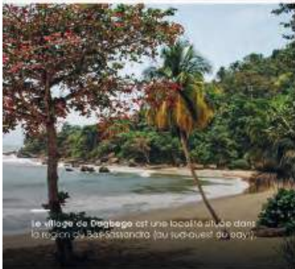
Le village de Dagbego est une localité située dans la région du Bas-sassandra (au sud-ouest du pays).