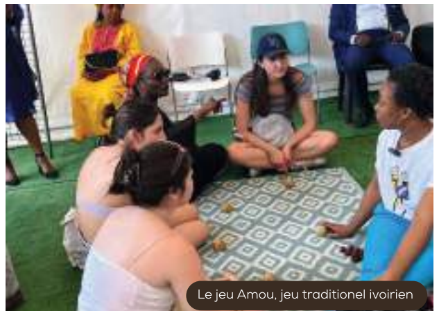
Le jeu Amou, jeu traditionnel ivoirien