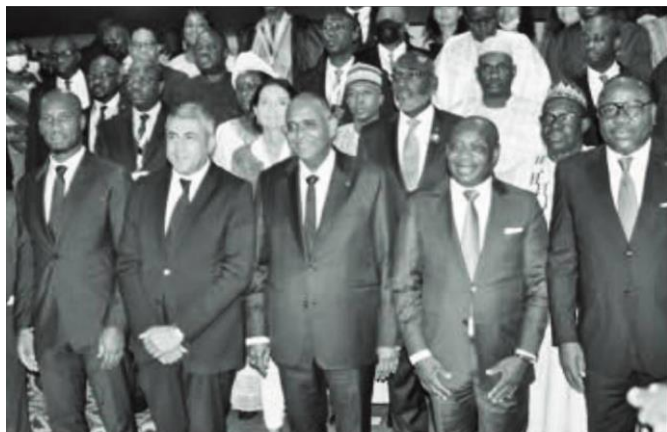
Les autorités ivoiriennes ont été félicitées pour avoir réussi l'organisation des festivités officielles de la Journée mondiale du tourisme (Jmt).