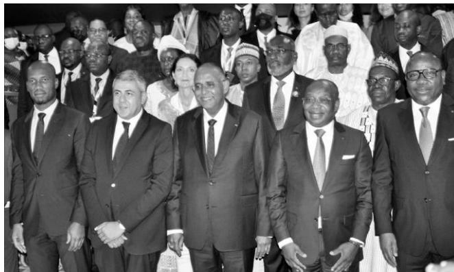
Le ministre Siandou Fofana, avec des personnalités politiques et touristiques.

La vision du Gouvernement de Côte d’Ivoire de faire du secteur touristique troisième pôle de son développement économique, s’est matérialisée par la mise en œuvre de la stratégie nationale de développement touristique 2018/2025 : « Sublime Côte d’Ivoire ». A mi-parcours, dans un contexte mondial marqué du sceau de la covid-19, quels en sont les acquis, les écueils et les perspectives ? Radioscopie d’une stratégie qui a fait les preuves de sa pertinence à l’aune des effets pervers d’une crise sanitaire planétaire qui n’a pas fini de perturber l’industrie touristique et qui incline à édicter de nouveaux paradigmes.